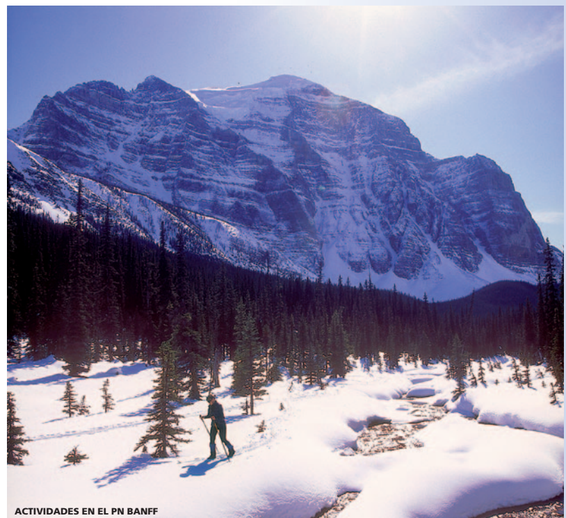
ACTIVIDADES EN EL PN BANFF