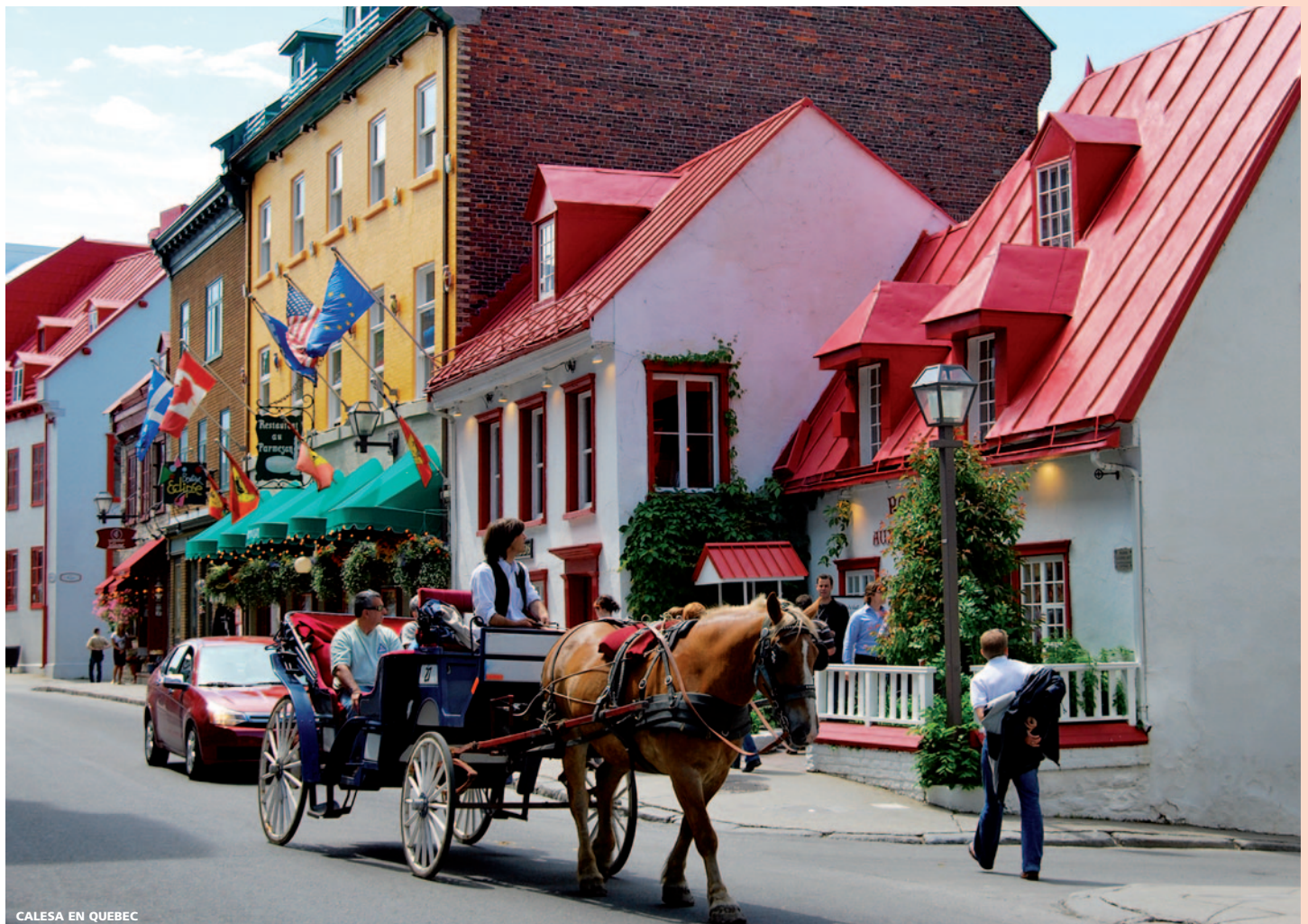
CALESA EN QUEBEC