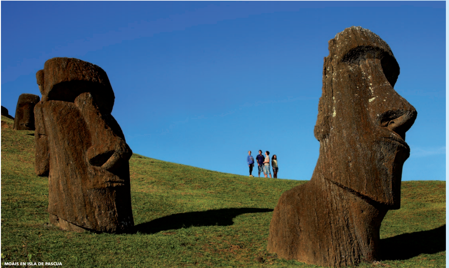
MOAIS EN ISLA DE PASCUA

menores de 7 años, mujeres embarazadas, adultos mayores y/o personas enfermas del corazón).