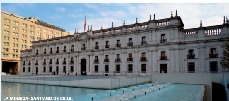
LA MONEDA- SANTIAGO DE CHILE

- Importante (Cias. Iberia y Latam): Cuando las fechas del viaje coincidan con dos temporadas aéreas distintas, se aplicará el precio base de la temporada y clase de reserva de la fecha de inicio del viaje mas el suplemento proporcional según la clase de reserva y temporada de la fecha de regreso