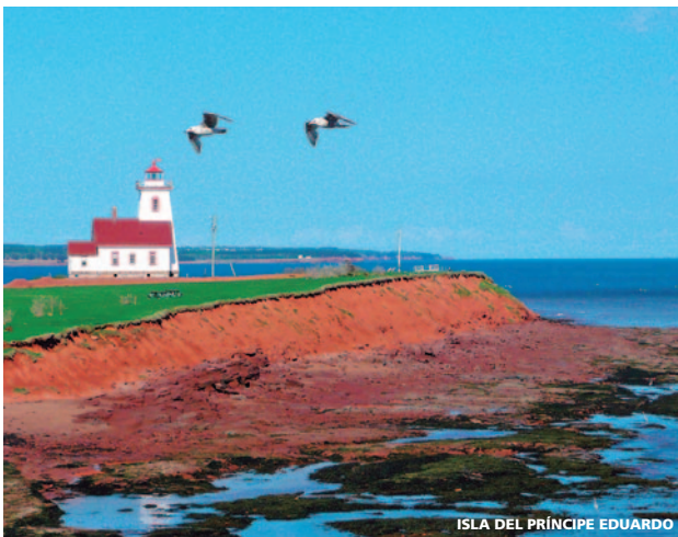
ISLA DEL PRÍNCIPE EDUARDO

Llegada a Charlottetown a las 08,00h. La Isla del Príncipe Eduardo es la provincia marítima más pequeña de Canadá esta unida a New Brunswick por un