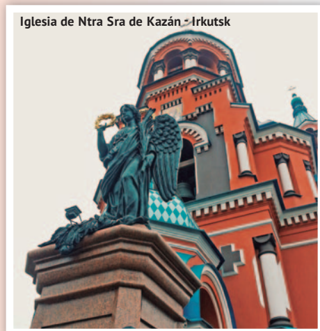
Iglesia de Ntra Sra de Kazán - Irkutsk

• Domingo • Desayuno. Traslado de salida al aeropuerto.