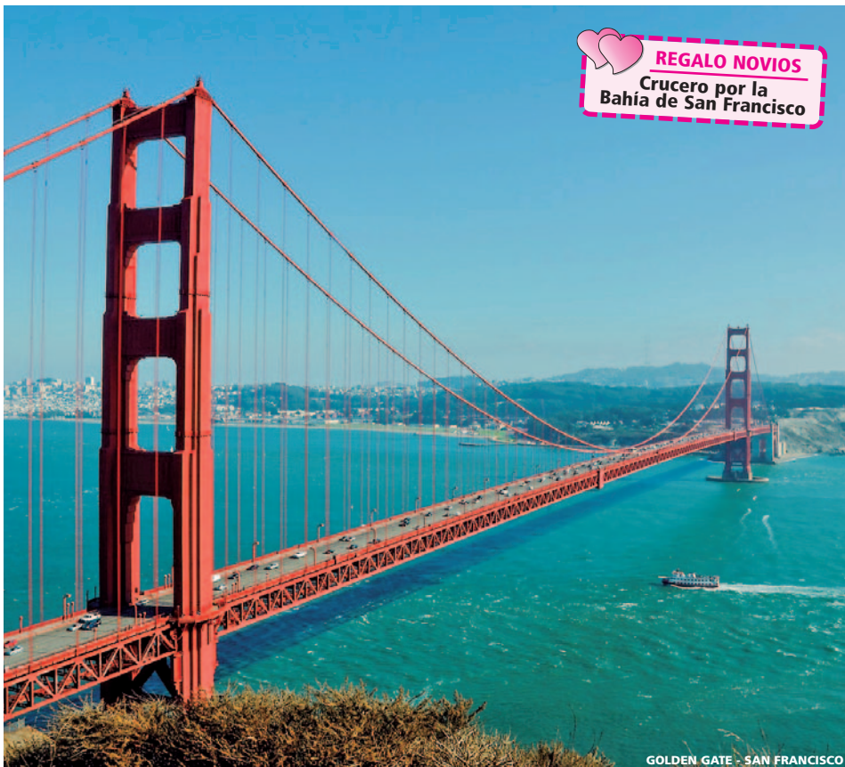
GOLDEN GATE - SAN FRANCISCO

Salidas en Español Salidas en Español y Portugués