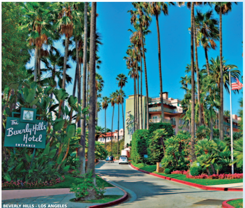
BEVERLY HILLS - LOS ANGELES