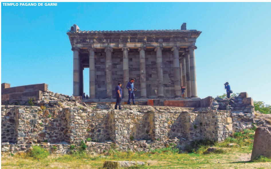
TEMPLO PAGANO DE GARNI

Este Programa Incluye: - Avión vuelo regular Madrid o Barcelona/Yereván y regreso con la cia. Air France (via París). - 6 noches de alojamiento en Yereván, base habitaciones dobles estándar, en régimen de media pensión. - Traslados aeropuerto/hotel/aeropuerto. - Transporte según programa en coche, minibus o autobuses de lujo con A/C. (Agua mineral cada día, por persona). - Guías de habla hispana. - Las visitas indicadas en el itinerario (con entradas incluidas). - Viaje en coches 4x4 por el desfiladero de Garni. - Mapa de Armenia y de la ciudad a la llegada. - Seguro de viaje. Este Programa NO Incluye: - Propinas, bebidas alcohólicas en las comidas, maleteros y y/o cualquier otro servicio no indicado específicamente en el itinerario indicado.