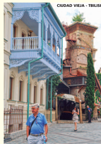
CIUDAD VIEJA - TBILISI

A la hora indicada se realizará el traslado al aeropuerto para tomar el vuelo regular de regreso a España.