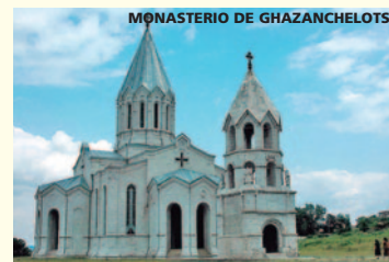
MONASTERIO DE GHAZACHELOTS

Salimos hacia Shushi. En el camino visita-