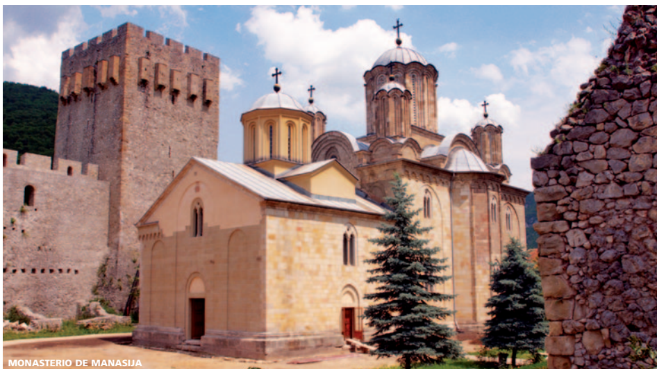
MONASTERIO DE MANASIJA