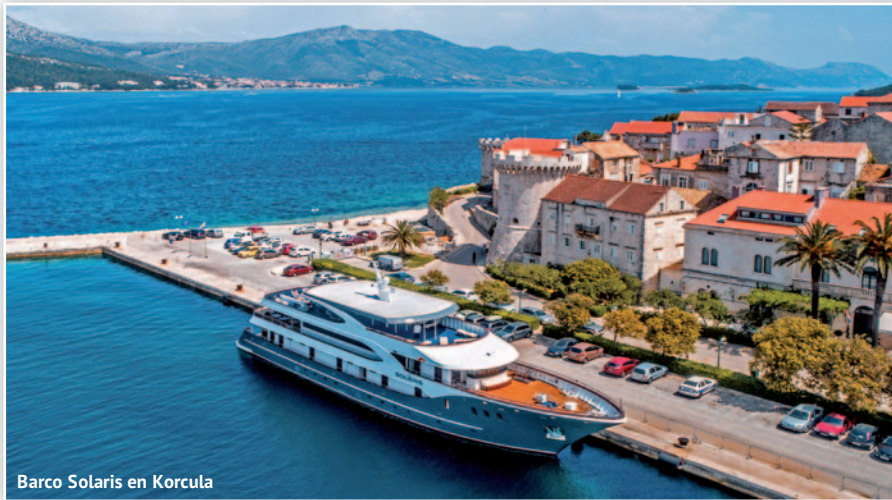
Barco Solaris en Korcula