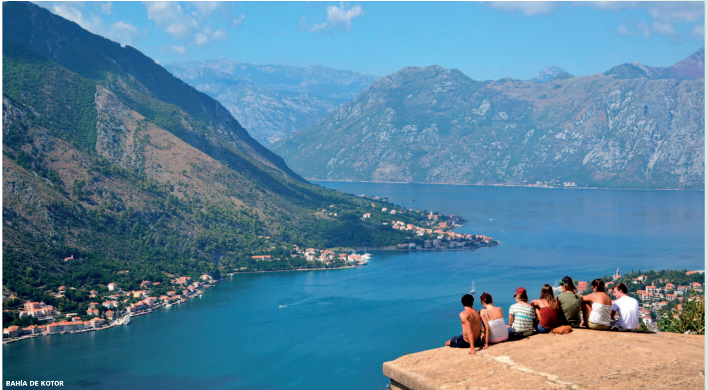
BAHÍA DE KOTOR

hacia la localidad de Ohrid. Llegada. Alojamiento en el hotel.