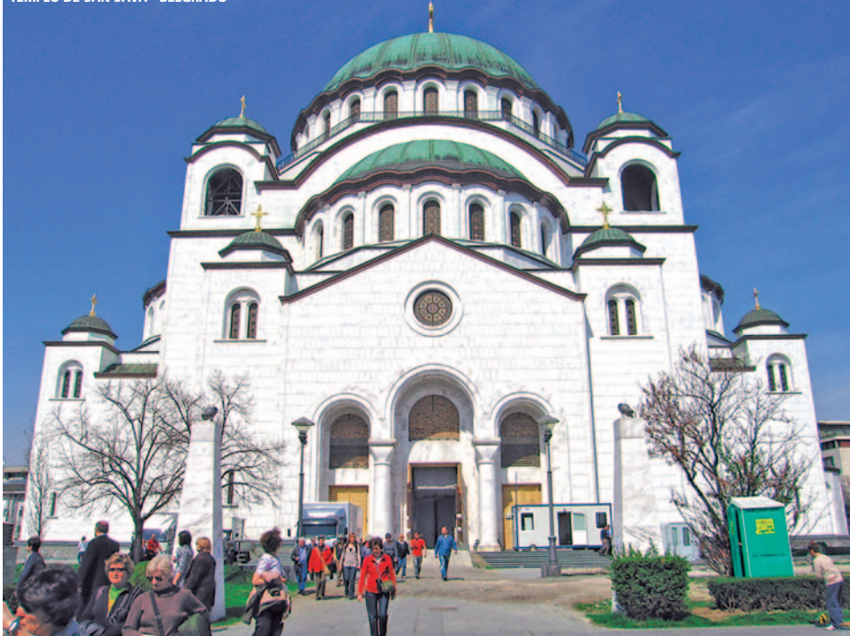
TEMPLO DE SAN SAVA - BELGRADO