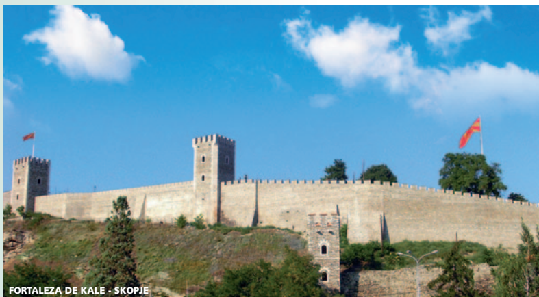
FORTALEZA DE KALE - SKOPJE

Por la mañana realizaremos la visita de Tirana : Plaza de Skenderbey, Mezquita de Ethem Bey y el Museo Nacional que alberga piezas arqueológicas y flujo de la historia de Albania. Por la tarde salida via Elbasan