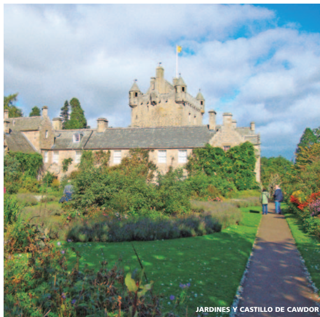
JÁRDINES Y CASTILLO DE CAWDOR

Salida hacia Elgin , donde podremos ver una de las catedrales de la época medieval más importantes de las Tierras Altas, la catedral de Elgin (entrada incluida) . Tiempo libre para almorzar (no incluido). Aprovechamos la siguiente parada para disfrutar del Castillo de Cawdor (entrada incluida) , relacionado con el famoso clan Campbell y todavía habitado hoy en día. Apreciaremos su construcción, sus históricos tapices y sus bellos jardines. Continuamos hacia Fort George (entrada incluida) , fortaleza junto al mar creada por los jacobitas tras la derrota de la batalla