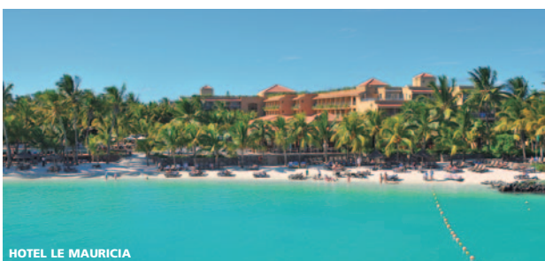
HOTEL LE MAURICIA

• Domingo. Llegada a París y conexión con vuelo destino España. Llegada.