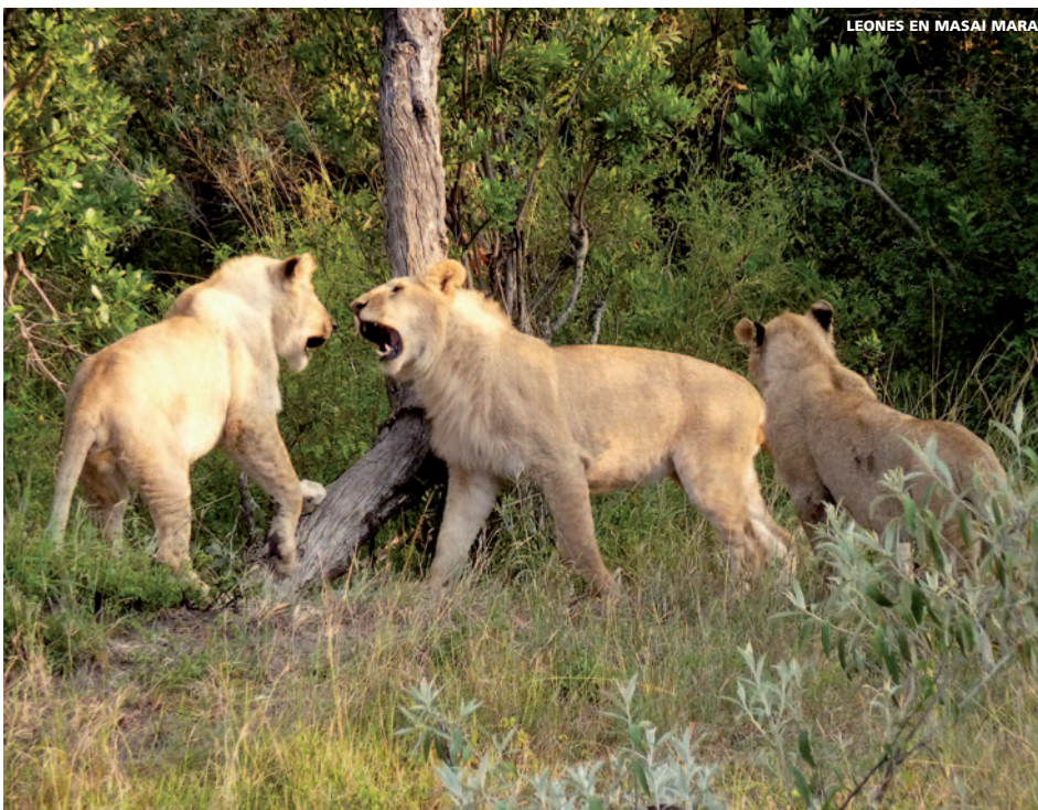
LEONES EN MASAI MARA