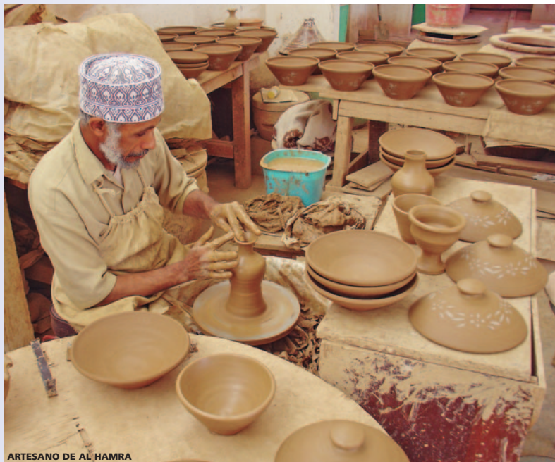
ARTESANO DE AL HAMRA

Salida para visitar Nizwa . Visita de la fortaleza , con su imponente torre de vigilancia y desde donde se puede disfrutar de una maravillosa vista del palmeral de Nizwa, las montañas y la cúpula de la mezquita. Tiempo libre para pasear por el famoso zoco conocido por su artesanía. A continuación nos dirigiremos hacia el desierto "Wahiba Sands" . Parada en el camino en los pueblos de Birkat Al Mauz , que han mantenido su atmósfera y carácter tradicional. Paseo por