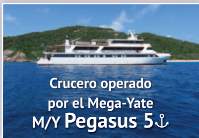
Crucero operado por el Mega-Yate M/Y Pegasus 5