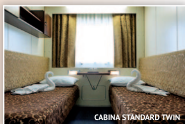
CABINA STANDARD TWIN