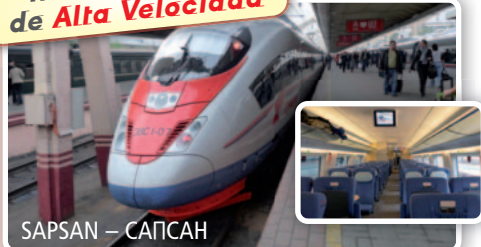
SAPSAN – САПСАН