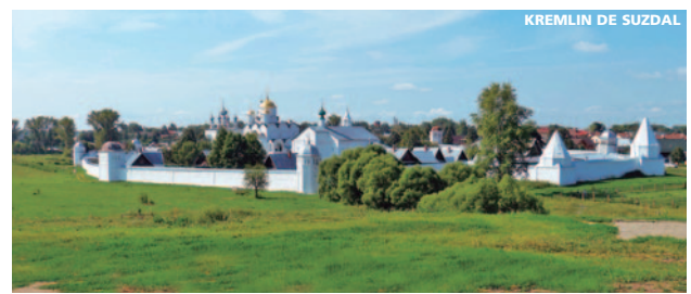
KREMLIN DE SUZDAL

Día 8º San Petersburgo/Vladimir/Suzdal • Sábado • Almuerzo + cena pic-nic. Mañana libre en San Petersburgo. Almuerzo en restaurante local. A la hora indicada traslado a la estación para tomar el tren de alta velocidad "Sapsan" con destino a Vladimir, enclavada en una zona repleta de bosques a orillas del río Kiazma. Posteriormente nos dirigimos a Suzdal , declarada Patrimonio de la Humanidad por la UNESCO, considerada una obra maestra de la arquitectura medieval rusa. Llegada, traslado al hotel, cena y alojamiento.