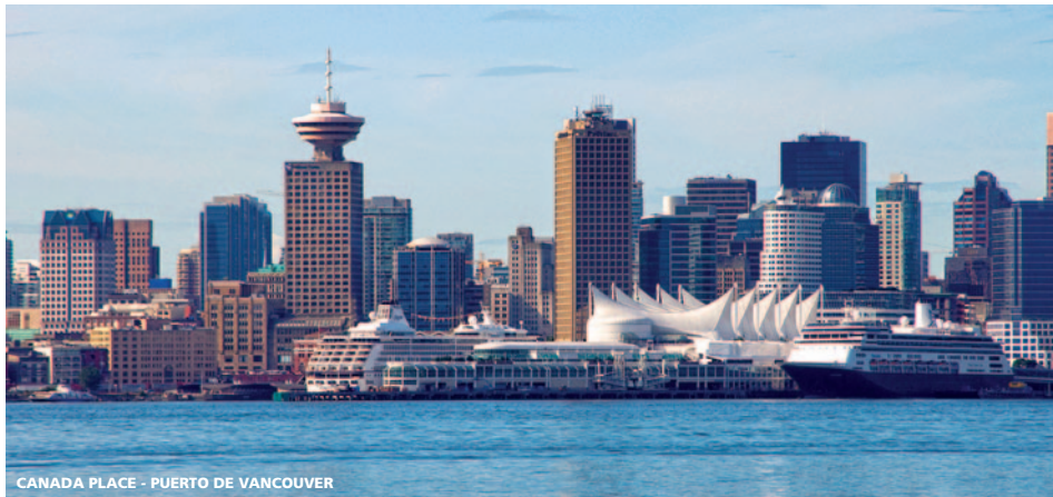
CANADA PLACE - PUERTO DE VANCOUVER