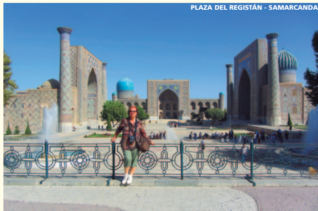
PLAZA DEL REGISTÁN - SAMARCANDA

De madrugada, traslado al aeropuerto para salir en vuelo de línea regular con la compañía Aeroflot, vía Moscú, con destino España.