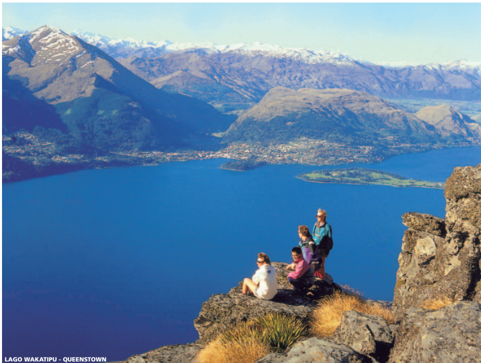
LAGO WAKATIPU - QUEENSTOWN

Visita medio día Queenstown. El mirador de Queenstown Hill es la primera de varias paradas para fotos y la vista se extiende hasta el lago Wakatipu y la Cordillera Remarkables. La excursión sigue la ruta a lo largo del brazo Frankton y pasando por el impresionante Lago Hayes, y en la boca de la Garganta de Kawarau, uno de los muchos lugares donde fil-