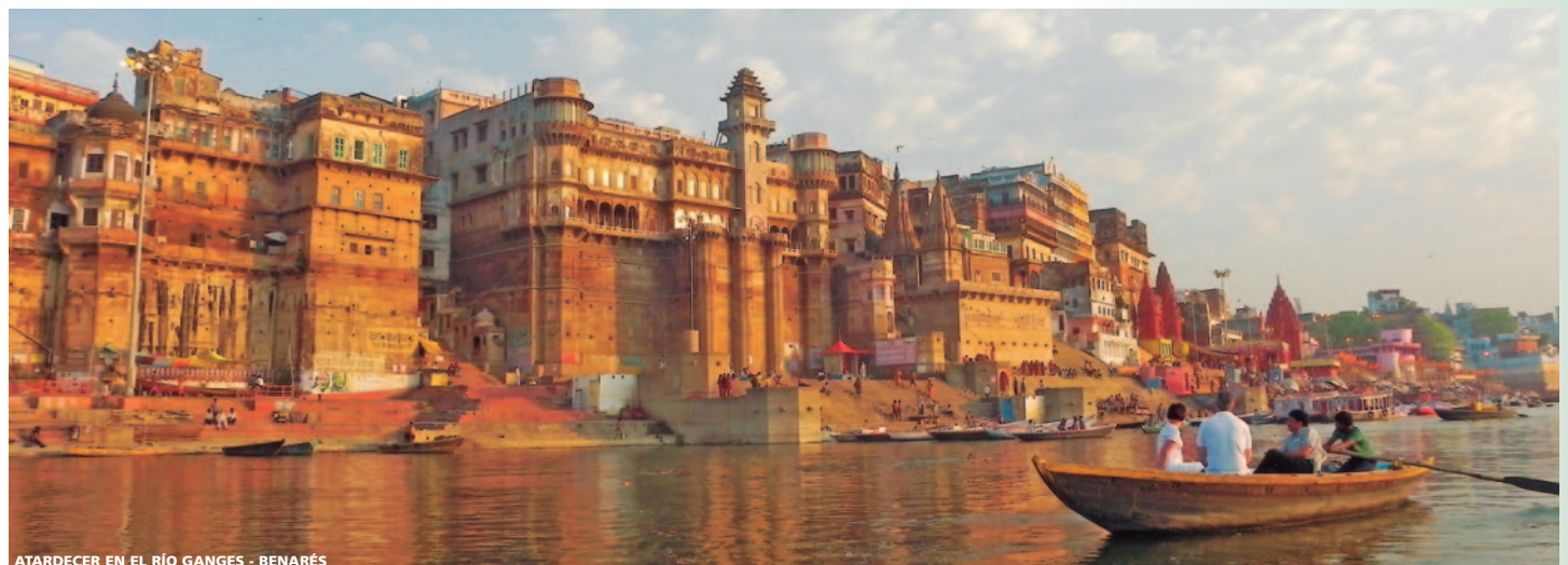
ATARDECER EN EL RÍO GANGES - BENARÉS