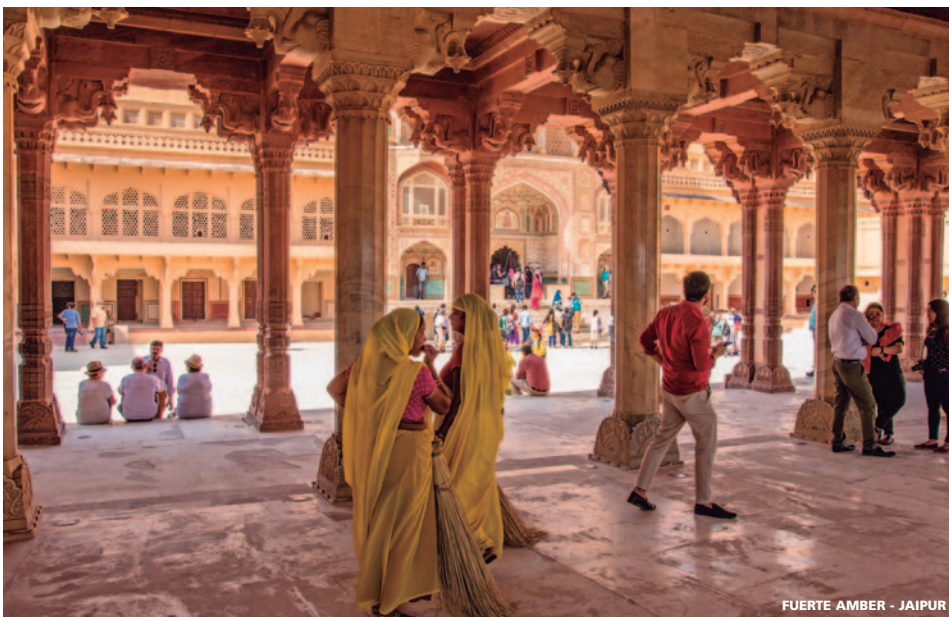
FUERTE AMBER - JAIPUR