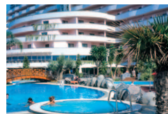
H. ROYAL SAVOY 5* R. Carvalho Araújo, 7 – Tel. 291 213 500