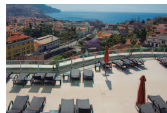
H. FOUR VIEWS BAÍA 4* Rua das Maravilhas, 74 – Tel. 291 700 200