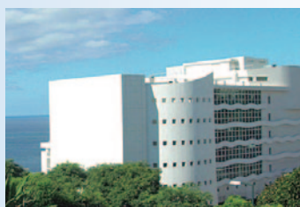
H. MELIA MADEIRA MARE RESORT & SPA 5* Rua de Leichlingen, 2 – Tel. 291 724 140