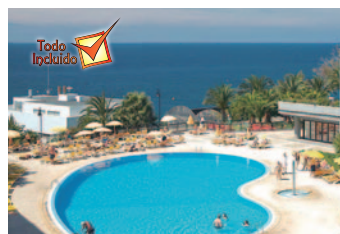
H. ENOTEL LIDO RESORT & SPA 5* (Rég. T.I.) Rua Simplicio dos Passos Gouveia, 29 – Tel. 291 724 239