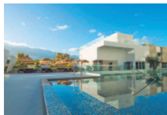
H. ALTO LIDO 4* Estrada Monumental, 316 – Tel. 291 700 410