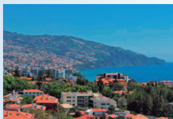
H. DORISOL BUGANVILLA 3* Rua Da Casa Branca, 98 – Tel. 291 706 615