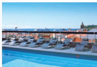
H. DO CARMO 3* Trav. Rego, 10 – Tel. 291 201 240