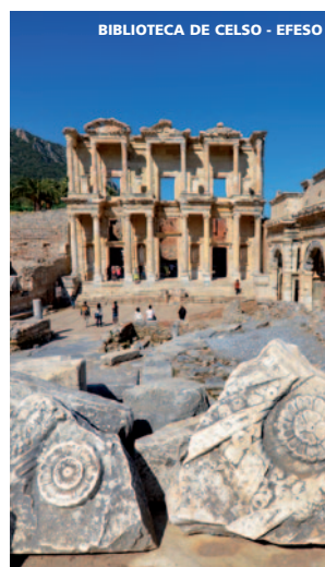
BIBLIOTECA DE CELSO - EFESO