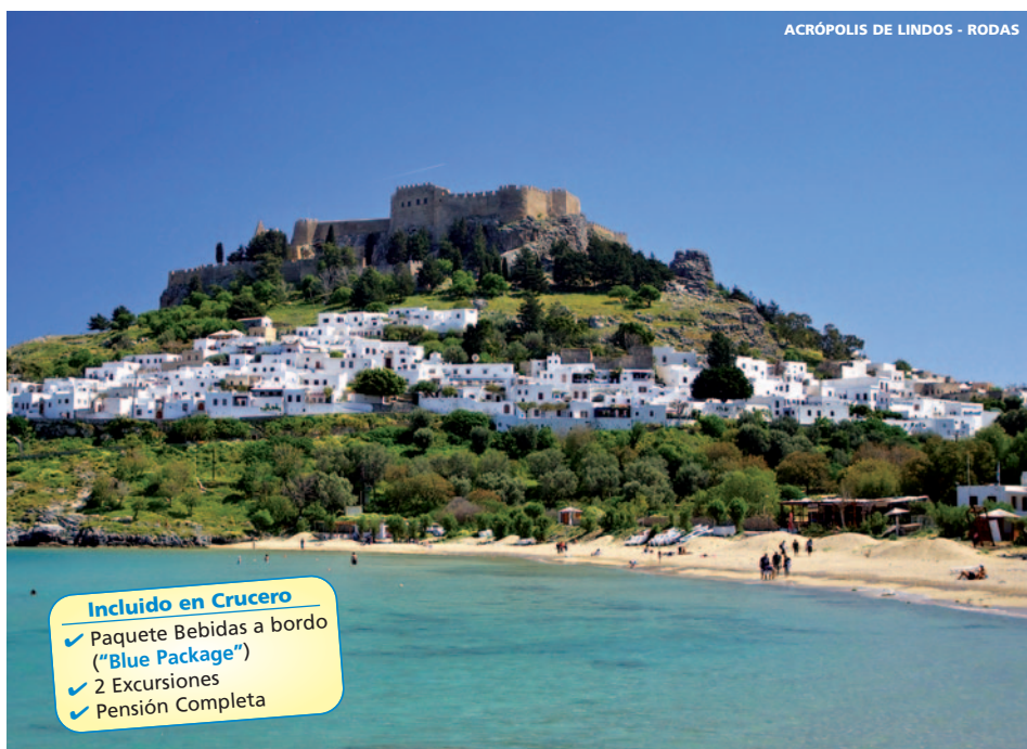
ACRÓPOLIS DE LINDOS - RODAS

8 días (3n hotel + 4n barco) desde 999 € (AVIÓN NO INCLUIDO)