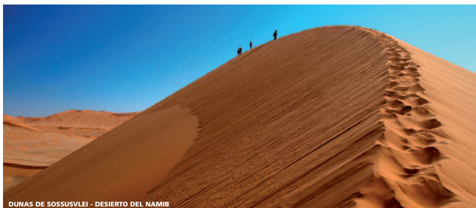
DUNAS DE SOSSUSVLEI - DESIERTO DEL NAMIB

12 días (9n hotel + 2n avión) desde 3.655 €