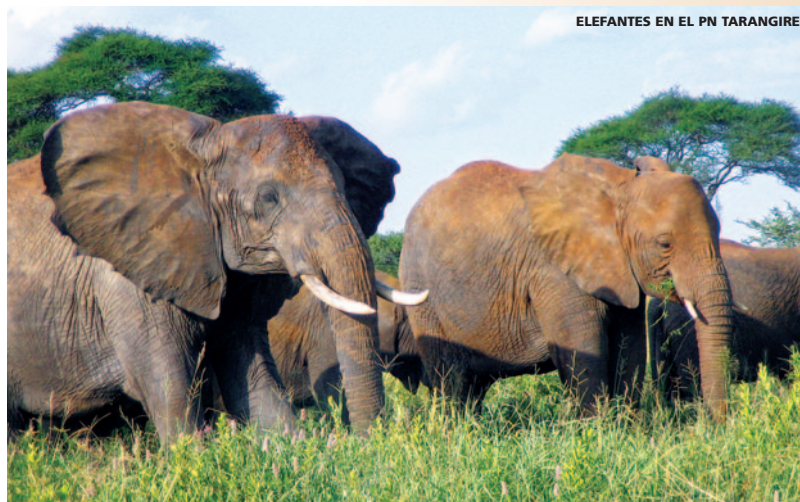
ELEFANTES EN EL PN TARANGIRE

Notas: Consultar salidas desde otras ciudades así como suplementos por volar en otras clases de reserva y/o salidas con diferentes Cías. aéreas. Reconfirmar precios a partir del 31 de Octubre de 2019.