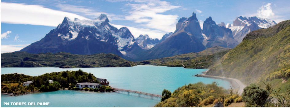
PN TORRES DEL PAINE

Incluyendo 12 DESAYUNOS, 2 ALMUERZOS y 16 VISITAS