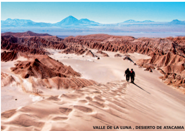
VALLE DE LA LUNA, DESIERTO DE ATACAMA

Llegada a Madrid. (Los Sres. Viajeros de Barcelona y otras ciudades continúan en vuelos nacionales a su lugar de origen).