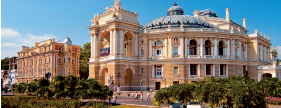
ÓPERA DE ODESA

A la hora indicada desembarque y traslado al aeropuerto.