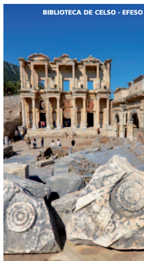
BIBLIOTECA DE CELSO - EFESO

*Precio basado en tarifas aéreas dinámicas, por lo que van cambiando en función de la ocupación del avión, por ello rogamos consulten el importe en el momento de realizar la reserva así como las tasas de aeropuerto y/o carburante correspondientes.