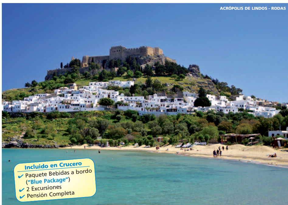
ACRÓPOLIS DE LINDOS - RODAS

8 días (3n hotel + 4n barco) desde 999 € (AVIÓN NO INCLUIDO)