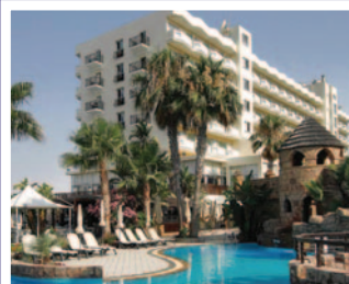
Hotel LORDOS BEACH 4* / LÁRNACA www.lordosbeach.com.cy

Suplemento por habitación vista mar (por persona y noche) ..... 20