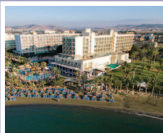
Hotel GOLDEN BAY 5* / LÁRNACA www.goldenbay.com.cy

Suplemento por habitación vista mar (por persona y noche) ..... 14