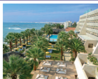
Hotel PALM BEACH 4* / LÁRNACA www.palmbeachhotel.com

Suplemento por habitación vista mar (por persona y noche) ..... 25