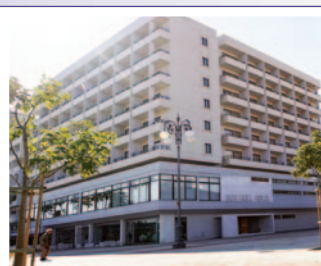
Hotel SUN HALL 4* / LÁRNACA www.sunhallhotel.com.cy

*Precio basado en tarifas aéreas dinámicas, por lo que van cambiando en función de la ocupación del avión, por ello rogamos consulten el importe en el momento de realizar la reserva así como las tasas de aeropuerto y/o carburante correspondientes.