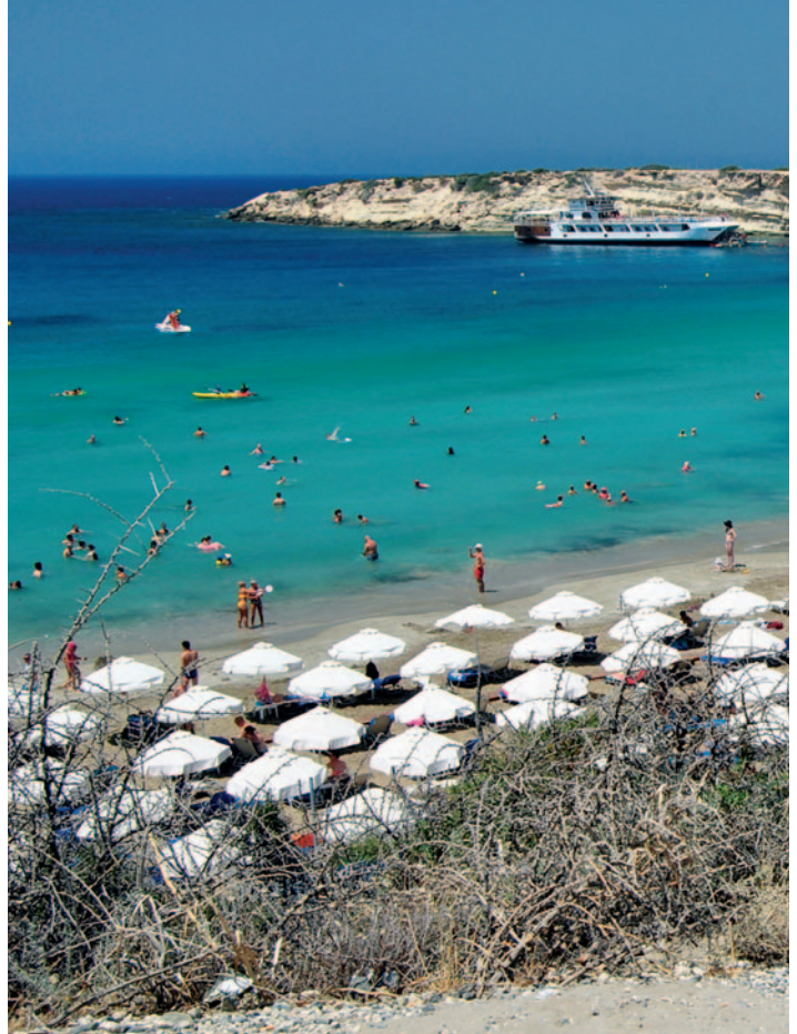
PLAYA EN PAFOS

Este Programa Incluye: 7 noches de alojamiento en el hotel elegido (o similar), en habitación estándar con baño y/o ducha, en régimen que corresponda; Traslados aeropuerto-hotel-aeropuerto; Seguro de viaje.