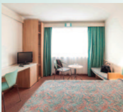
① H. IBIS PARLEMENT 3*S www.accorhotels.com/es