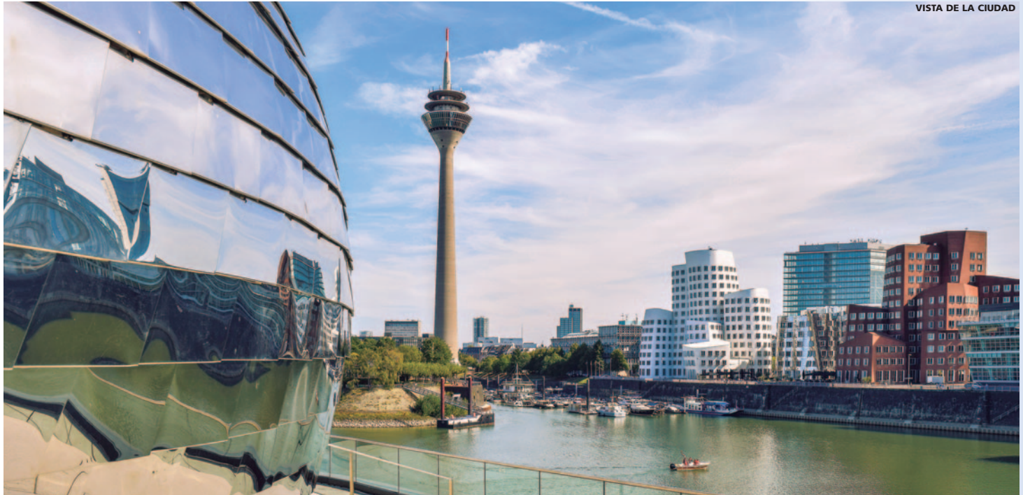
VISTA DE LA CIUDAD

Notas: - Los precios publicados no pueden aplicarse durante la celebración de Ferias. Consultar suplementos. - Suplemento sólo servicios de tierra 20 € (total por reserva). - Rogamos consultar precios a partir del 1 de Noviembre.