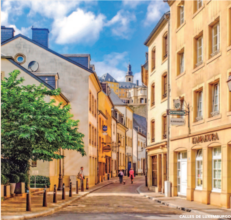
CALLES DE LUXEMBURGO