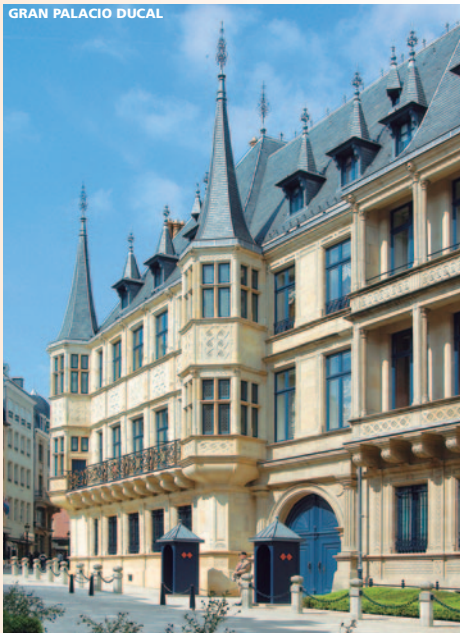
GRAN PALACIO DUCAL