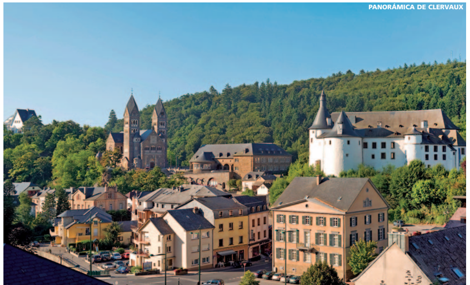
PANORÁMICA DE CLERVAUX