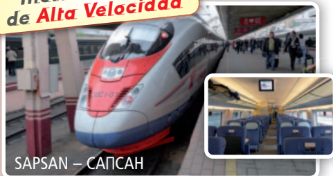
SAPSAN – САПСАН