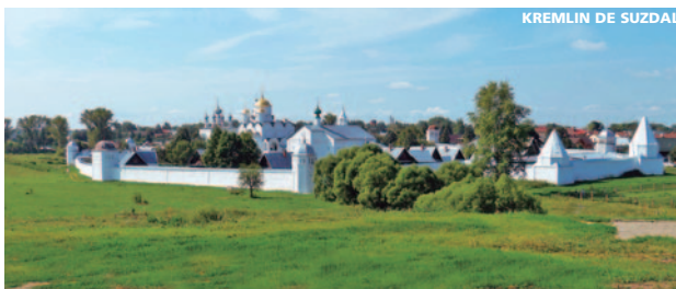
KREMLIN DE SUZDAL

Por la mañana realizaremos un recorrido a pie por el centro , incluyendo el Palacio del Gobernador y la Torre