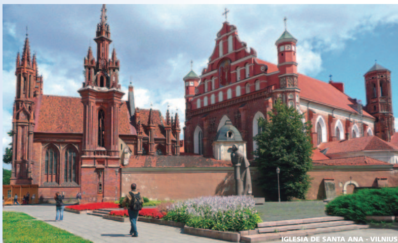
IGLESIA DE SANTA ANA - VILNIUS

Por la mañana visita panorámica de la ciudad , declarada Patrimonio mundial de la Humanidad por la UNESCO. Veremos la avenida Nevsky, con sus prestigiosos edificios: Palacio Anichkov, Palacio Belozersky, catedral de Nuestra Señora de Kazán etc. Pasaremos por el Almirantazgo y su imponente flecha dorada, símbolo de la fuerza naval rusa Terminaremos ante la bella Catedral de San Nicolás de los Marinos, rodeada de canales. Visita de la Fortaleza de Pedro y Pablo . Situada en una pequeña isla frente al Palacio del Invierno, La Fortaleza estaba destinada a proteger la ciudad de las incursiones por vía marítima. Los Zares la utilizaron después