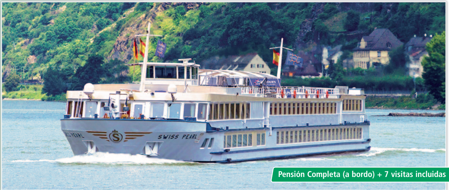
Pensión Completa (a bordo) + 7 visitas incluidas

Salidas LUNES (18 Mayo a 12 Octubre 2020)