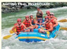
RAFTING EN EL RÍO PACUARE

Desafiara treinta kilómetros de aguas remotas y pintorescas que corren a través de un área silvestre llena de una exuberante vegetación la cual cubre los escarpados desfiladeros que se levantan a lo largo de sus riberas. La densa maleza es refugio de jaguares, ocelotes, monos, perezosos, y de otras numerosas especies de pájaros y animales. Almuerzo. Deberán estar en condición física adecuada para esta excursión, aunque no se hace necesaria ninguna experiencia previa de viajes en balsa. Incluye kayakuista de seguridad.