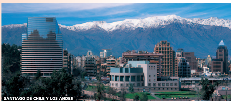
SANTIAGO DE CHILE Y LOS ANDES

Salida para visitar el Salar de Atacama , el más grande de Chile y uno de los más grandes del mundo. Aquí encontraremos la Laguna Chaxa donde habitan 3 diferentes especies de flamencos. Luego nos dirigiremos camino hacia el Altiplano para llegar al mirador de Piedras Rojas , donde podrán observar un conglomerado volcánico formado a partir de la oxidación del hierro presente en aquel lugar. Posteriormente visitaremos las Lagunas Altiplánicas Meñique y Miscanti , situadas a 4.500 metros sobre el nivel del mar. Esta área es parte de la Reserva Nacional Los Flamencos. Las lagunas se encuentran rodeadas de imponentes volcanes originados producto del levantamiento de los Andes en tiempos geológicos remotos. Por último, visitaremos el pintoresco poblado de Toconao donde su atracción principal es la Campana de la Torre construida de manera clásica atacameña. Regreso a San Pedro de Atacama y alojamiento. (Nota: No recomendable para niños menores de 7 años, mujeres embarazadas, adultos mayores y/o personas enfermas del corazón).