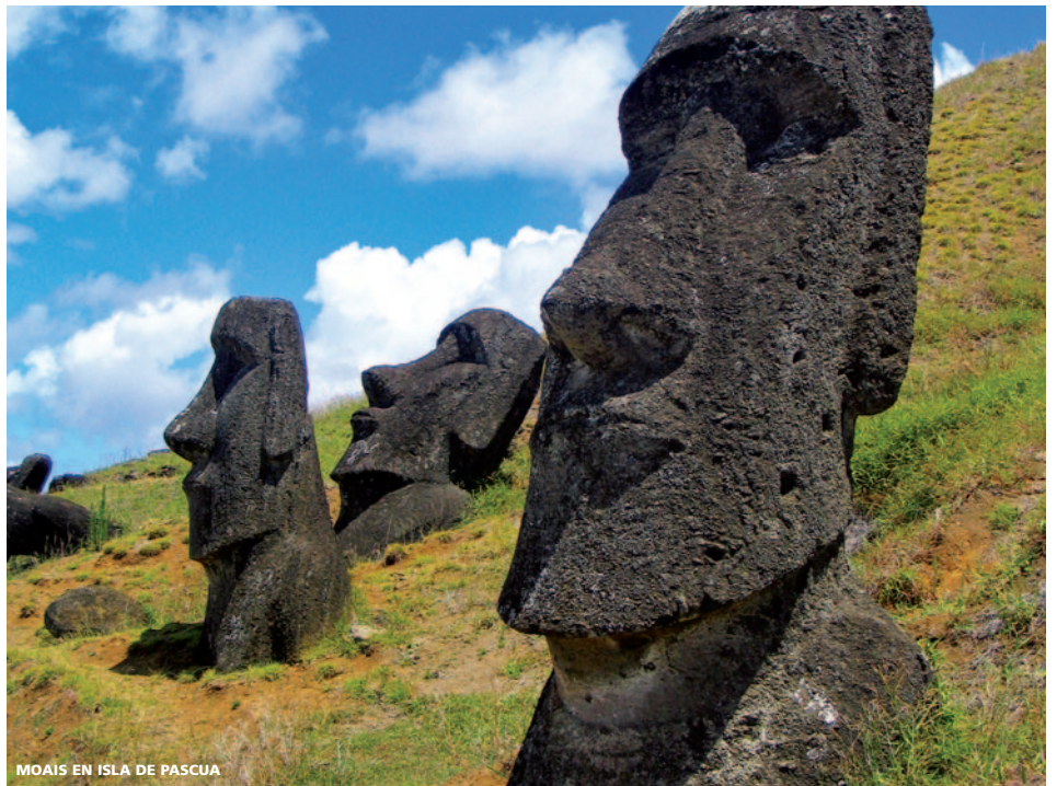
MOAIS EN ISLA DE PASCUA