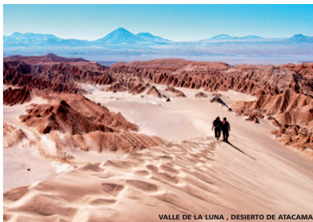
VALLE DE LA LUNA, DESIERTO DE ATACAMA

Llegada a Madrid. (Los Sres. Viajeros de Barcelona y otras ciudades continúan en vuelos nacionales a su lugar de origen).