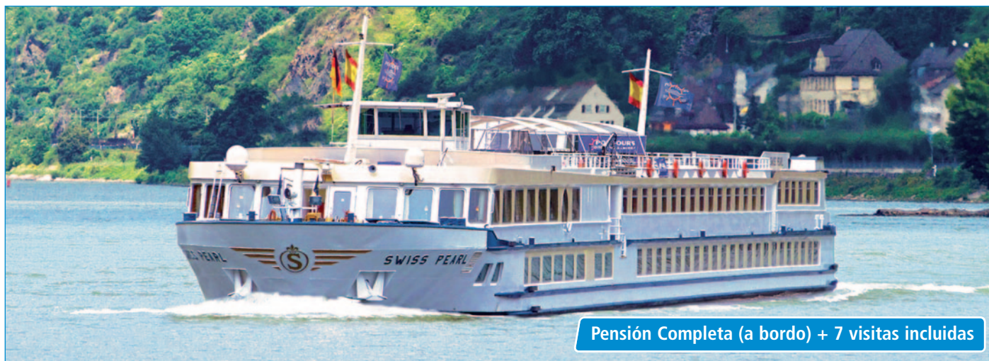
Pensión Completa (a bordo) + 7 visitas incluidas

Salidas LUNES (18 Mayo a 12 Octubre 2020)