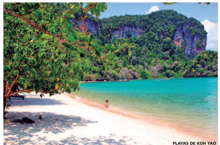
PLAYAS DE KOH YAO