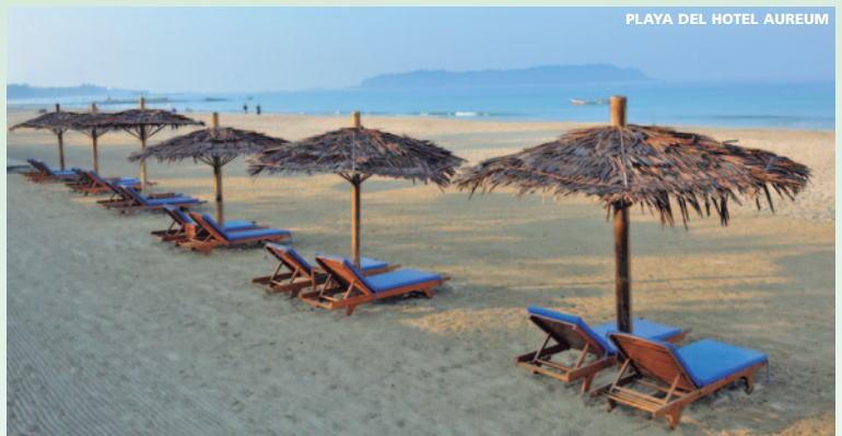
PLAYA DEL HOTEL AUREUM