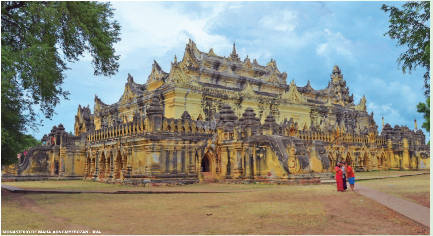
MONASTERIO DE MAHA AUNGMYEBOZAN - AVA

era ahuyentar a posibles secuestradores. Caminata de 45 min para llegar a la primera aldea donde veremos a las mujeres Padaung. Por la tarde, nos dirigiremos de vuelta a Loikaw. Por el camino, visitaremos algunas de las aldeas para conocer el Takon Dhaing, mástiles sagrados de los espíritus Nat. Muchas de estas tribus han sido convertidas al cristianismo (algunas al budismo), pero aún mantienen algunas de sus costumbres amistosas tradicionales. Traslado al hotel y alojamiento.