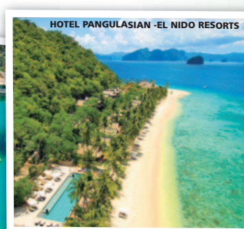
HOTEL PANGULASIAN - EL NIDO RESORTS