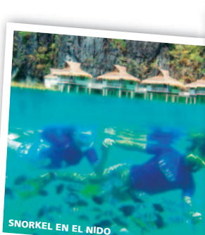
SNORKEL EN EL NIDO