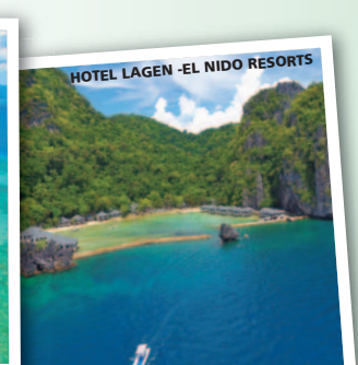
HOTEL LAGEN - EL NIDO RESORTS