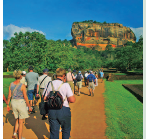
ROCA DEL LEÓN - SIGIRIYA