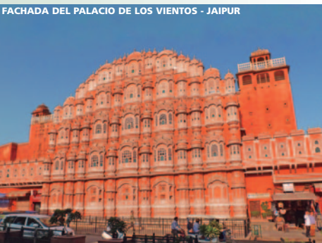
FACHADA DEL PALACIO DE LOS VIENTOS - JAIPUR