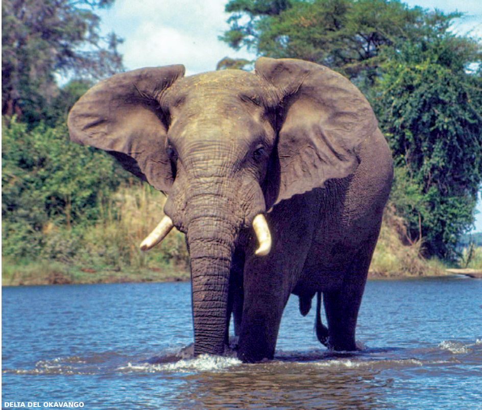
DELTA DEL OKAVANGO

9 días (6n hotel + 2n avión) desde 3.325 €