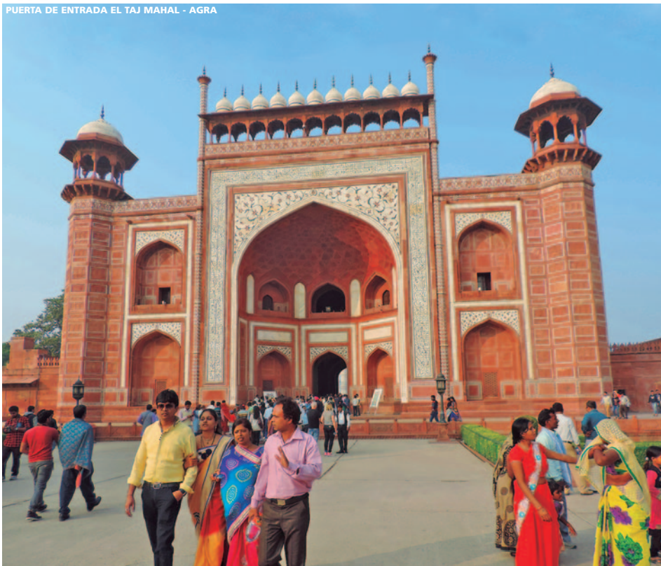
PUERTA DE ENTRADA EL TAJ MAHAL - AGRA