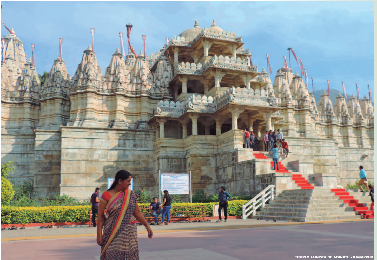
TEMPLO JAINISTA DE ADINATH - RANAKPUR

rio construido por el Shah Jahan como símbolo del amor a su mujer Mumtaz Mahal, es hoy una de las maravillas del mundo. Llegada. traslado al hotel y alojamiento.