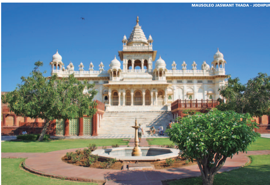
MAUSOLEO JASWANT THADA - JODHPUR