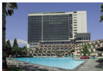
H. PESTANA CARLTON OCEAN RESORT 5* Largo António Nobre, 1 – Tel. 291 239 500